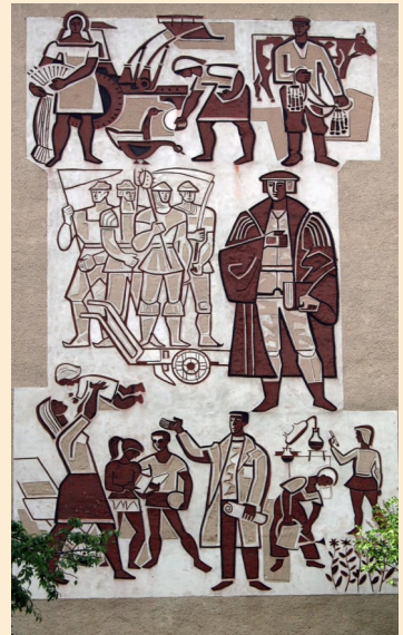
Bild: Karl Holfeld, Sgraffito, 1970, POS Thomas Müntzer, Bodenrode, 2012 entfernt

Ort: Liborius-Wagner-Haus, Waidstraße 26, 99974 Mühlhausen